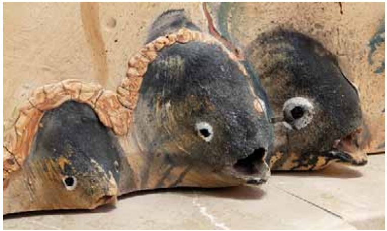
Detalle de la multiplicación de los peces.

It must be born in mind that light is the symbolic key to the chapel, for that reason the electrical lighting process has been conceived as a tool at the service of the precinct's triple function: exhibition, liturgy and prayer. Thus, the different levels of light intensity were tuned by means of alternative combinations of focusing and exploring, with the purpose of allowing the recreation of the expected atmospheres.