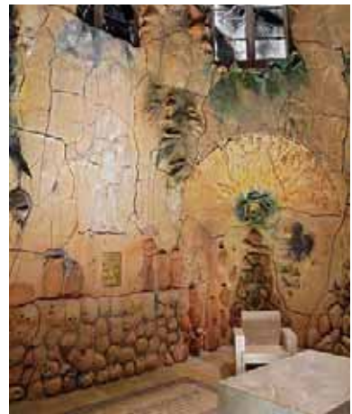
La gruta de la multiplicación de los panes.