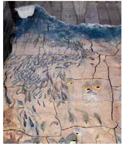
Detalle de la gran ola con los peces.

«Las grietas son una gran red, son como las termitas de África, dan un sentido involuntario a todo, dan una ligazón, una idea del tiempo. Las grietas hacen ligar perfectamente esta piel de arcilla con Gaudí y Jujol, las grietas hacen que la obra coja su lugar allá dentro gracias a su organicidad. El dibujo que hacen las grietas seguro que Gaudí y Jujol lo habrían firmado de golpe. Seguro. Me gusta la escritura de Jujol en forma de algarrobas, creo que hay una especie de comunión, de diálogo de mi obra y las suyas.»