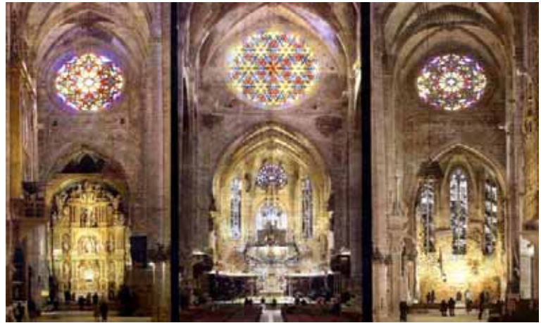
Las capillas del Corpus Christi (s. XVI), de la Trinidad (s. XIV-XIX) y del Santísimo Sacramento (s. XXI).

The second stage was developed around lighting, both natural one, through the windows, and electric one. The boards presented by Barceló, image-less and in bluish, khaki and greenish hues for the five windows, were approved by the Chapter on 9 April 2005. Nevertheless, they were modified by the painter and later installed