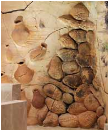
Detalle de la gruta de la multiplicación de los panes.