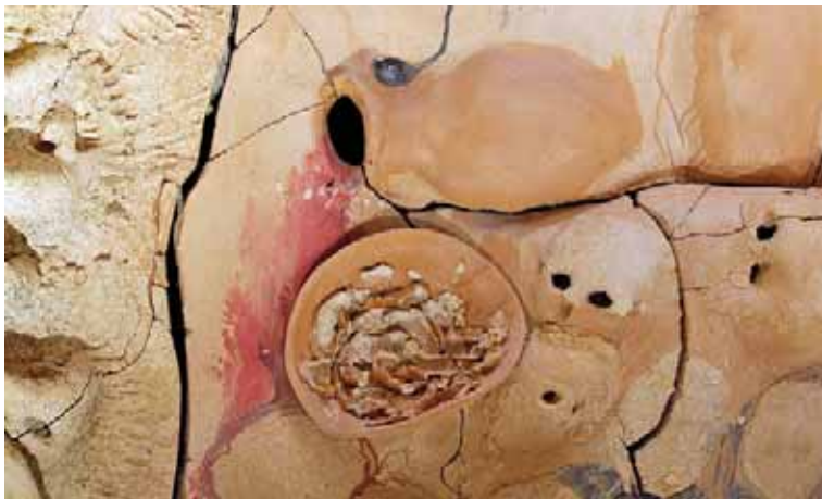
Detalle de los frutos de la tierra: el vino.