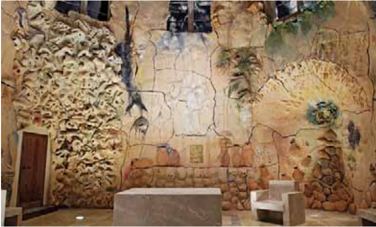
El mobiliario litúrgico (altar y sede) en el conjunto de la capilla.

escritura esgrafiada sobre una superficie estofada de líquido de plomo que reproduce la luz del fondo del mar.