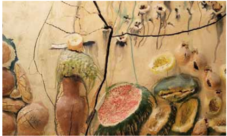
Detalle de los frutos de la tierra: higos, sandías y melones.

«I knew that a ceramic wall is already a space which is made regardless of the architecture. The ceramic wall is a support and a work at the same time. That was the first thing that I found exciting about the chapel: a whole work with that mass of mud; it was a way to enter something absolutely organic. It is an architectural work and it goes beyond that; it somehow perverts architecture, it makes it unnecessary. There is only an echo behind it, a resonance of architecture.»