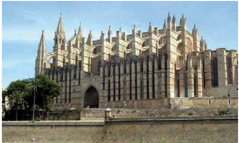
La catedral de Palma de Mallorca, vista desde el mar. En primer término, la capilla del Santísimo.

His intervention was approved on 16 December 2000 by the Cathedral's Chapter in a chapter vote, as well as the removal of Saint Peter's neo-classical altarpiece in order to open the five windows contemplated by the artist in the chapel. It was technically argued that this choice was appropriate due to the imbalance between the said Saint Peter's chapel compared to the neighbouring chapels at the head. The main altar and the Trinity chapel from the 14th century constitute, at the cathedral axis, an accumulation of artistic testimonials from various historical epochs, with highlights in Gothic, Renaissance and Modernist forms, also reinforced by the wonderful light from stained-glass windows and rosettes. In turn, the Corpus Christi chapel, located at the left side apse, contains the most formidable early-Baroque altarpiece in the cathedral's precinct. Another issue under discussion was the darkness in the chapel due to the total blocking of the five windows, which throws the light perception out of balance. Not just the perception of the head focal points, but also of the inner light circuits, so the symbolic possibilities of the Gothic cathedral were devaluated. The final consideration was that it was absolutely necessary to act in order to allow the integration of the most recent contemporary art in the historical building, according to the logical continuity with the already-present tradition of the Majorca cathedral,