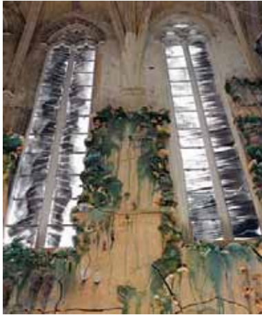
Las polémicas vidrieras de grisalla aportan luz submarina al espacio.

the heritage formed by the historical image of Saint Peter's chapel legitimate? Should the cathedral become a place for contemporary art experiments? How do you solve the unavoidable interferences between the cathedral-temple and the cathedral-heritage? These and other questions will generate a debate; however, what remains nowadays is the bravery of the option in spite of the risks. The late Bishop Teodor Úbeda, who died in May 2003, and the Cathedral Chapter answered the challenge launched by Miquel Barceló and, in the midst of the difficulties encountered through this 7-year-long path, the project was always defended in coherence with the idea of the Majorca cathedral as an open and incomplete work, a witness to all the moments in its biographical course. A course directly and consciously linked to Bishop Campins's liturgical reform and to its spatial and decorative refurbishment carried out by Gaudí & Jujol since 1904.